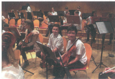
學生參加在德國舉行的國際音樂匯演