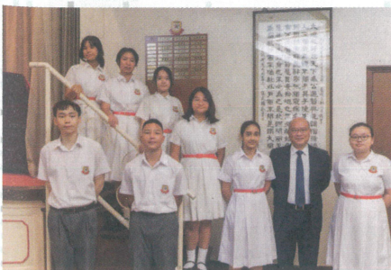
孔聖堂中學有來自超過15個國家的學生，學校積極舉行文化交流活動，促進校園共融