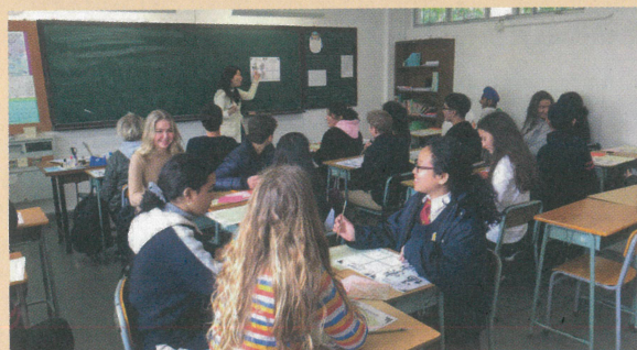
丹麥交流生訪校，與本校學生一起上課

基礎和非基礎部分，讓數學能力稍遜的非華語學生專注掌握基礎部分，無需在有限時間內強記艱深的進階概念，有助於公開試取得更佳成績。」