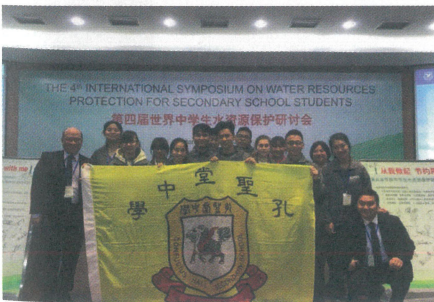
五位學生代表前往南京參與第四屆世界中學生水資源研討會，並與其他國家學生參觀南京水利項目

學校的非華語學生來自巴基斯坦、菲律賓、尼泊爾、泰國、印度、英國及法國等地。與校內不同級別、族裔的學生傾談，不難發現在中英夾雜的交談中，感受到校園輕鬆融洽的氣氛和學生的活力。這除了歸功於學校秉持「以儒治學」理念的成果之外，學校近年更成立多元文化組，聘請少數族裔學習助理，舉辦不同族裔的文化活動，如多元文化周，加深不同族裔學生的相互了解和接納，成功建立多元文化共融的校園。