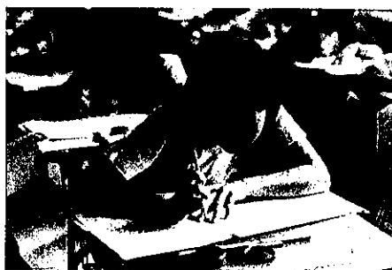
畫畫比賽的參賽者水準甚高。