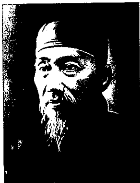
尤列曾參與籌建孔聖堂。他年輕時曾與孫中山、陳少白、楊鶴齡並稱「四大寇」。

壽、黃季熙、李景康等十一位籌備員籌建孔聖堂，而過百名的總務值理中包括陳煥章、朱汝珍、賴際熙、區大典、溫肅等名儒在內，並由尤列起草宣言。尤列，與孫中山、陳少白、楊鶴齡被清廷目為「四大寇」，四人經常在香港中環歌賦街二十四號的楊鶴齡祖產商店楊耀記處會面，並議論中國時政，大談反清逐滿，倡言革命，鼓吹共和。尤列創立「中和堂」，即後來的「中國中和黨」，他曾與孫中山手訂國號「中華民國」。茲錄宣言部份內容，以記當時建堂的目的，〈為籌建香港孔聖講堂宣言〉：