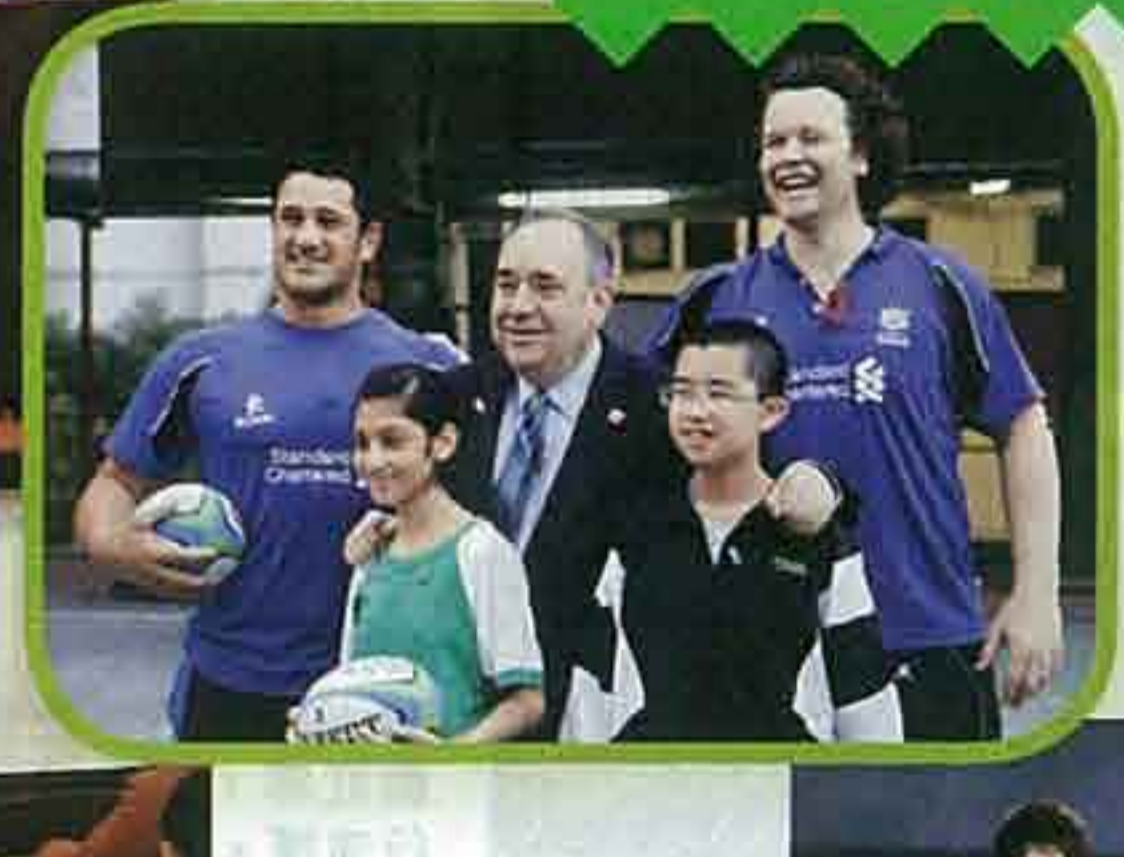
▲該校積極發展格鬥球運動，蘇蒙球訓練，長蘇蒙球計劃的情況。