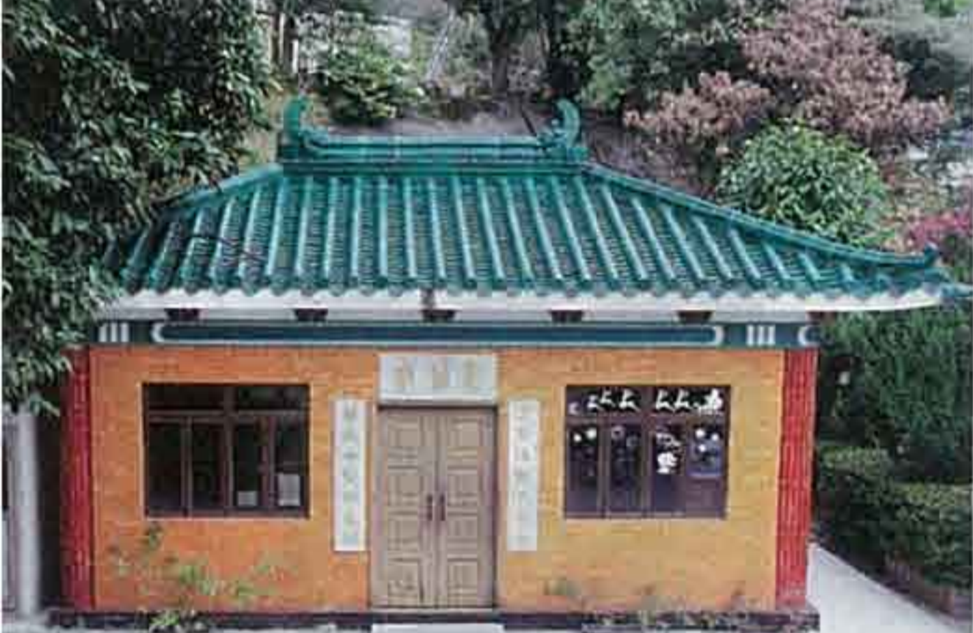
▲該校禮堂在二次大戰前，是香港唯一開放的公眾會堂，並有包括：郭沫若、茅盾、蕭紅等，曾在禮堂進行演講。