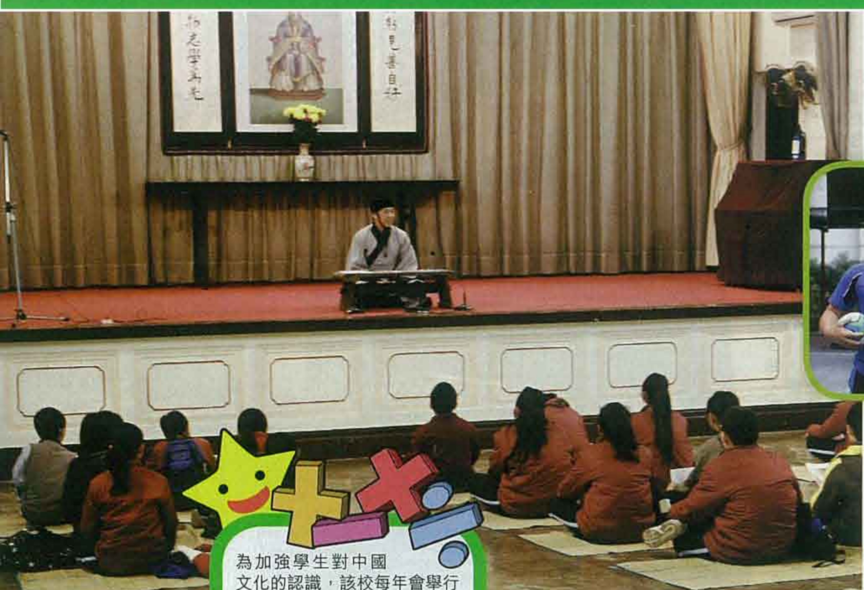
為加強學生對中國文化的認識，該校每年會舉行中華文化博覽，學生們在禮堂習禮。