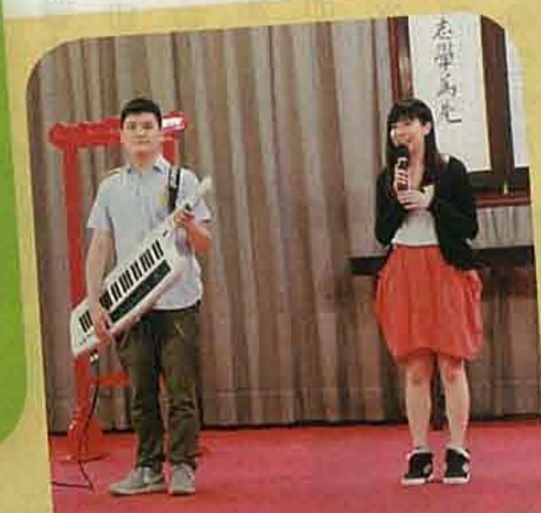
▲著名音樂人兼校友古馳（左），為該校六十年創作主題曲，並於校慶啟動禮當日回校高歌。