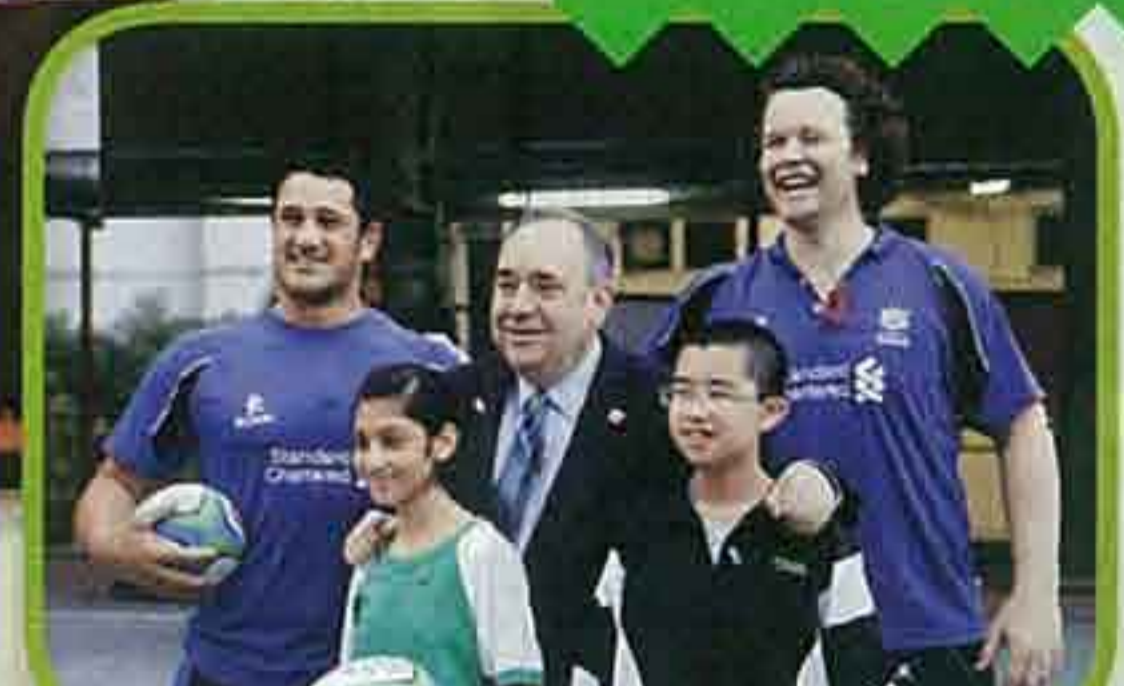
▲該校積極發展格鬥運動，蘇蒙球訓練，長蘇蒙球計劃的情況。