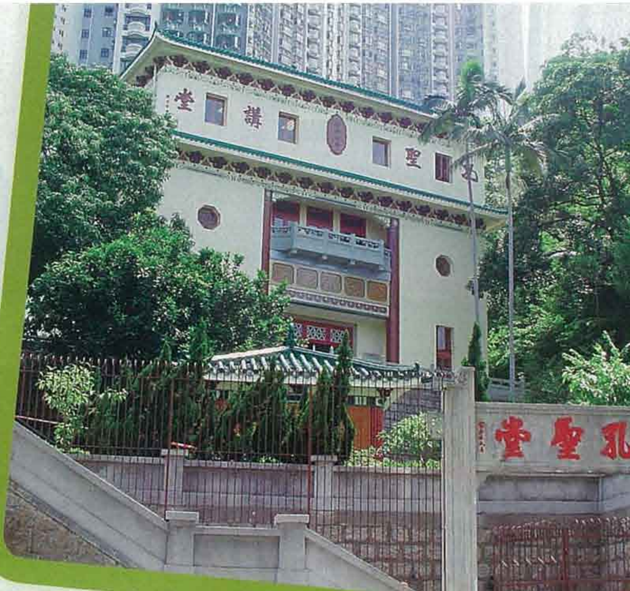
▲該校的校舍富有中國色彩，其中這座仿似廟宇的書劍軒，原來是用作英文科上課的地方。