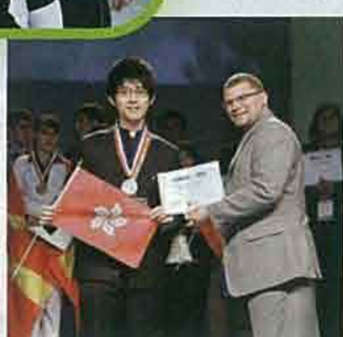
▲該校學生曾參加一些國際性的交流活動，好像有學生曾前往南京五日夜的第二屆世界中學生水資源保護研討會，當中有德國、印度和美國等學校的學生參加。該校學生還即場匯報對世界水資源缺乏的專題報告，除增加學生運用英語溝通的膽量之外，更幫助學生具備國際視野。因該校亦有取錄非本地學生，可以加強學生的共融和交流。