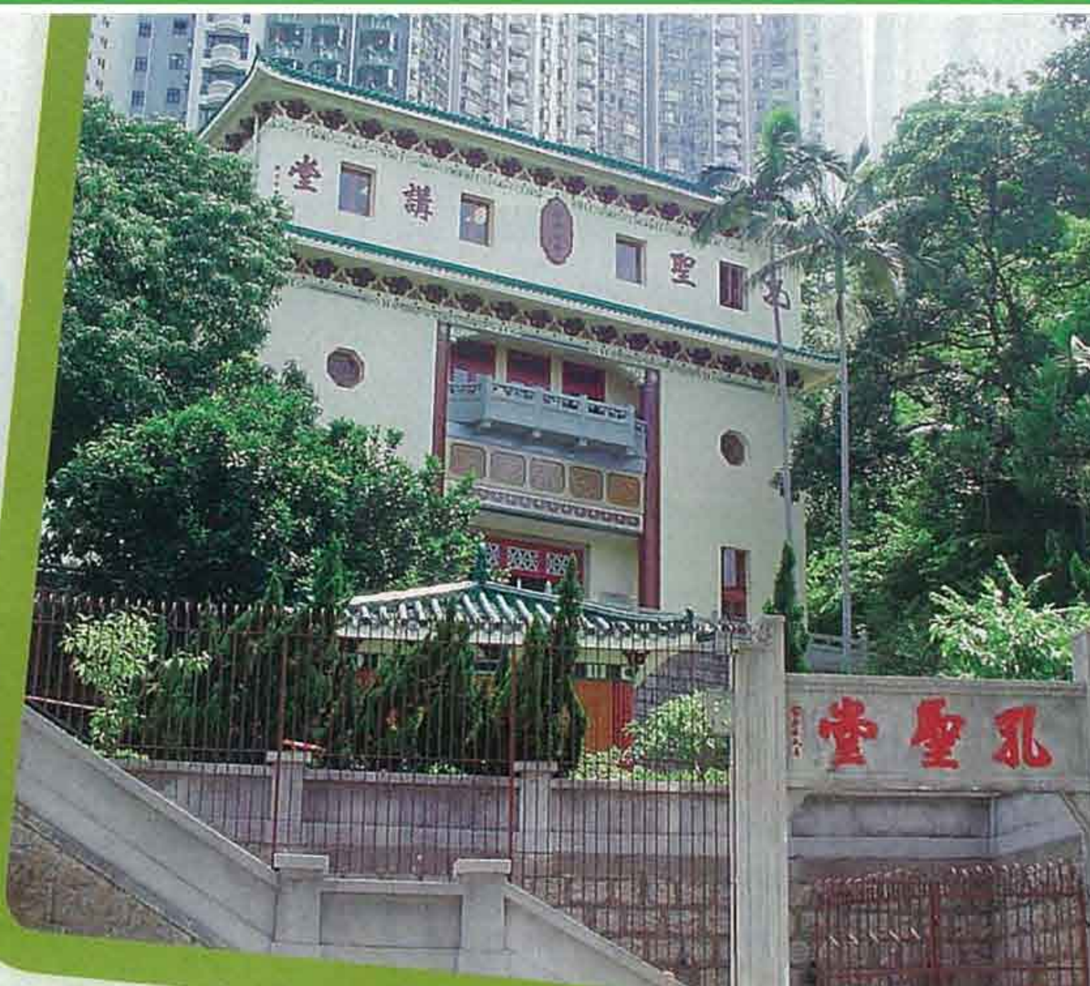
▲該校的校舍富有中國色彩，其中這座仿似廟宇的書劍軒，原來是用作英文科上課的地方。