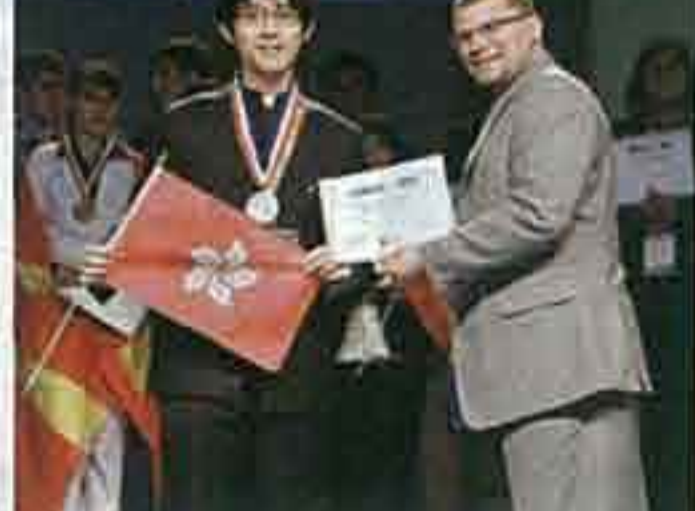
▲該校學生曾參加一些國際性的交流活動，好像有學生曾前往南京五日夜的第二屆世界中學生水資源保護研討會，當中有德國、印度和美國等學校的學生參加。該校學生還即場匯報對世界水資源缺乏的專題報告，除增加學生運用英語溝通的膽量之外，更幫助學生具備國際視野。閱