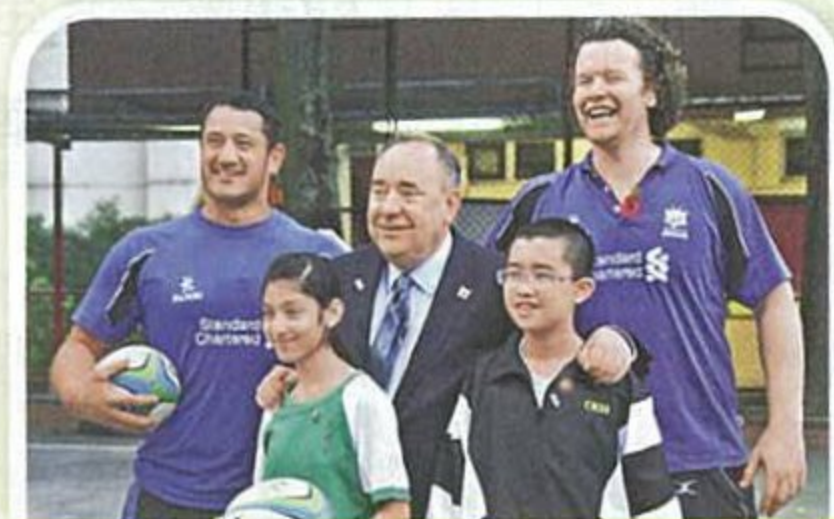
• 蘇格蘭首席大臣薩蒙德到校參觀欖球計畫(School of rugby)情況。

孔聖堂中學向來着重學生的體育及藝術發展，除要求所有中一學生必須學習一種樂器及加入制服團隊，亦鼓勵學生自行創辦學會，「希望透過羣體生活，訓練學生的自理能力。」楊校長又指，為開拓學生國際視野，學校於二〇一三年與香港欖球總會宣布全港首個欖球學校計畫（Schools of Rugby），「該計畫源於蘇格蘭，透過進行專業欖球訓練，不但鍛煉學生體格，更以此為載體，從課室外建立學生『朝着目標奮鬥的動力、態度和行為，以及改善學生品格、責任心，還有對同學和對學校的歸屬感。』」該校更特地成立欖球學會，每周由專業欖球員教授學生欖球，藉此建立團隊精神和紀律。