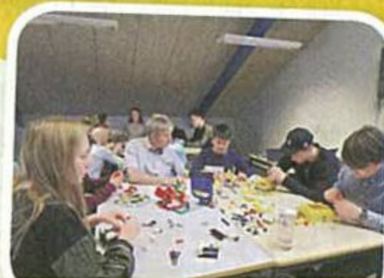
• 學生參與兩星期丹麥Odsherreds Efterskole中學深度交流活動，入住當地家庭及出席課堂。