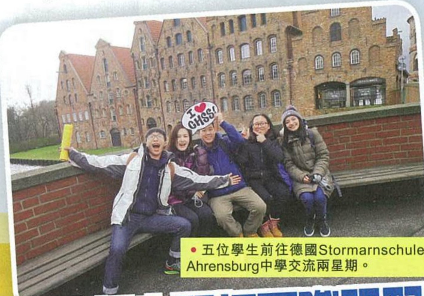
• 五位學生前往德國Stormarnschule Ahrensburg中學交流兩星期。