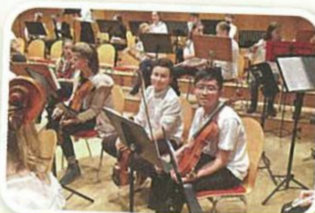
• 學生參加在德國舉行的國際音樂匯演一星期。