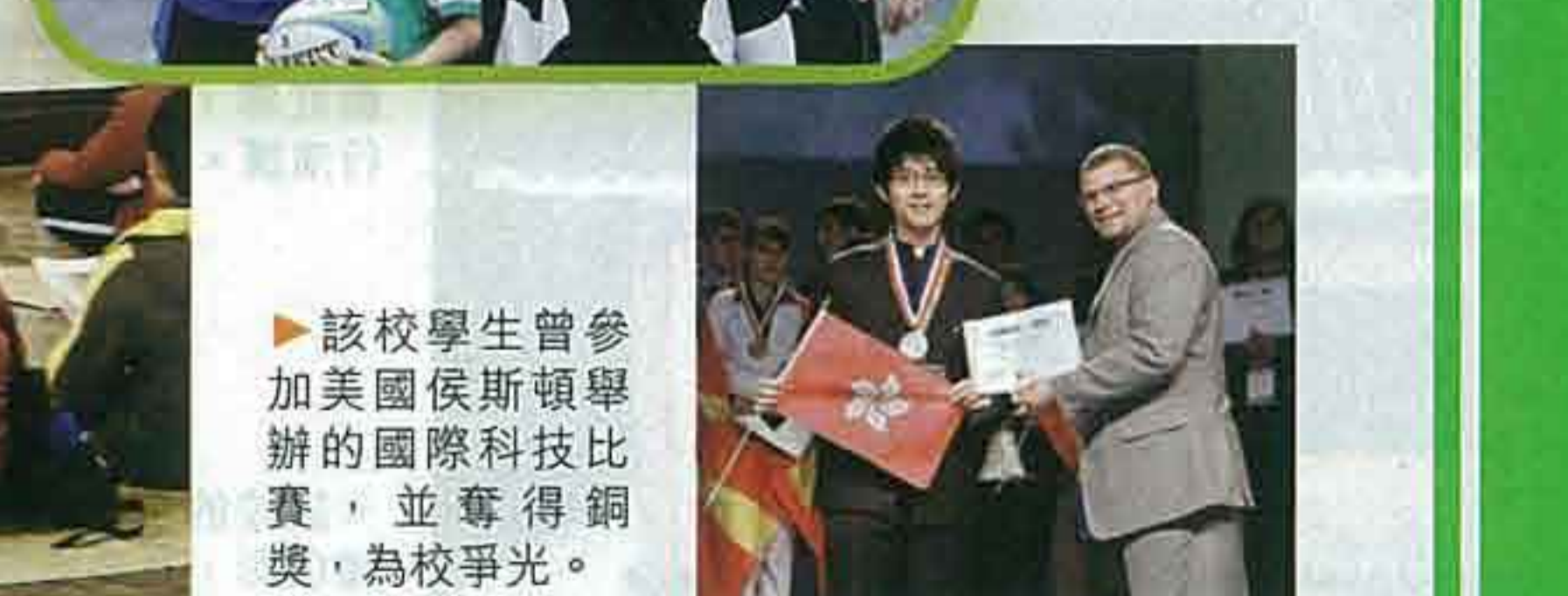
▲該校學生曾獲多項國際獎項，並為校爭光。