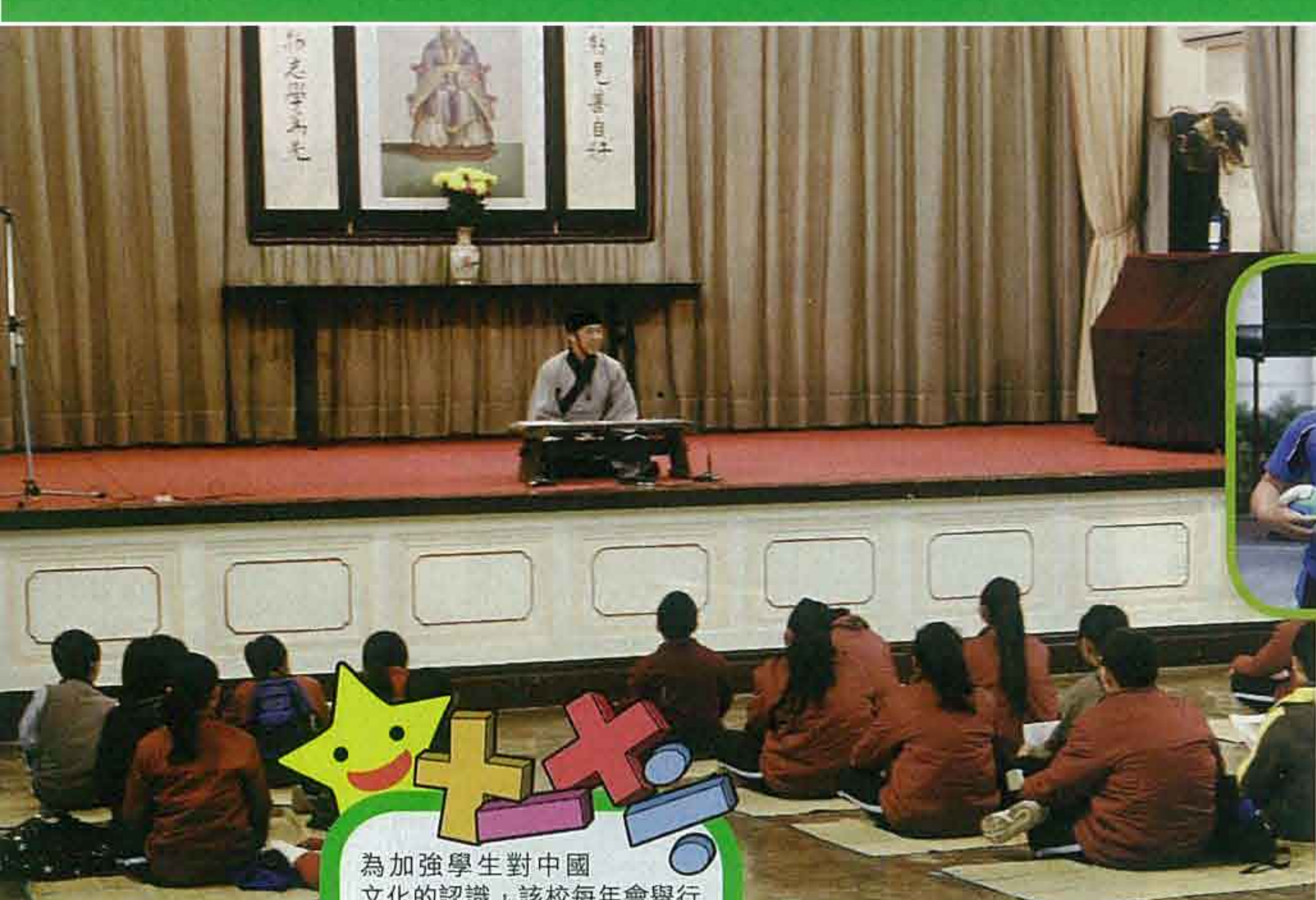
為加強學生對中國文化的認識，該校每年會舉行中華文化博覽，學生們在禮堂習禮。