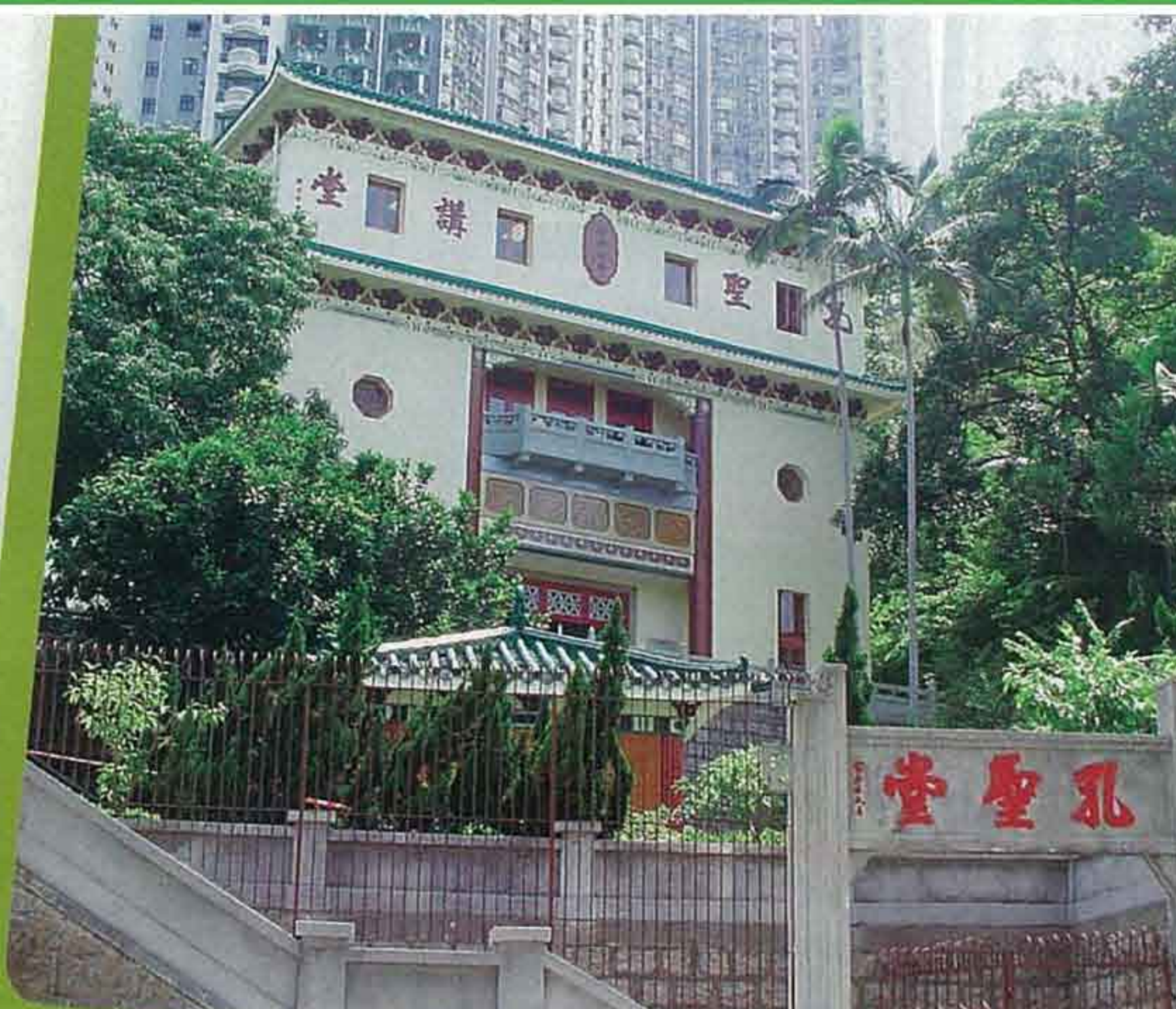
▲該校的校舍富有中國色彩，其中這座仿似廟宇的書劍軒，原來是用作英文科上課的地方。