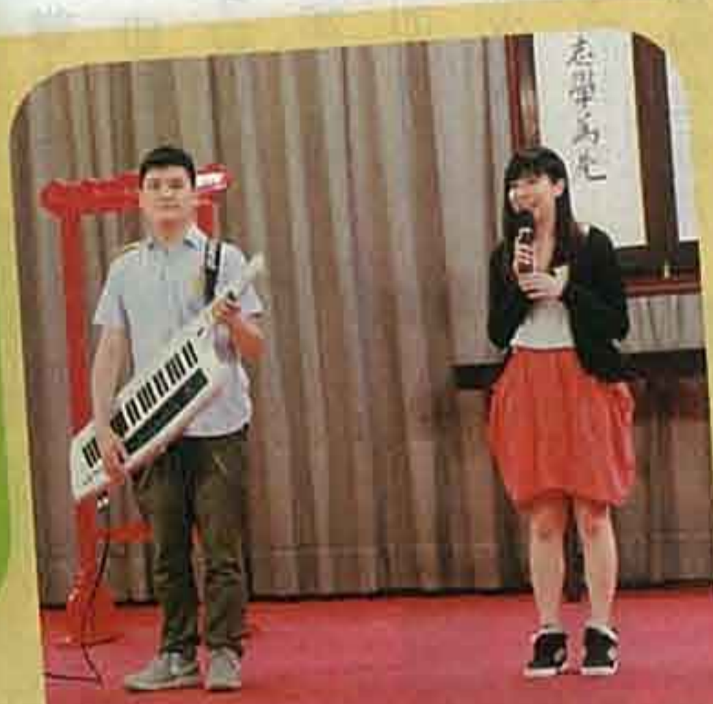
▲著名音樂人兼校友古馳（左），為該校六十年創作主題曲，並於校慶啟動禮當日回校高歌。