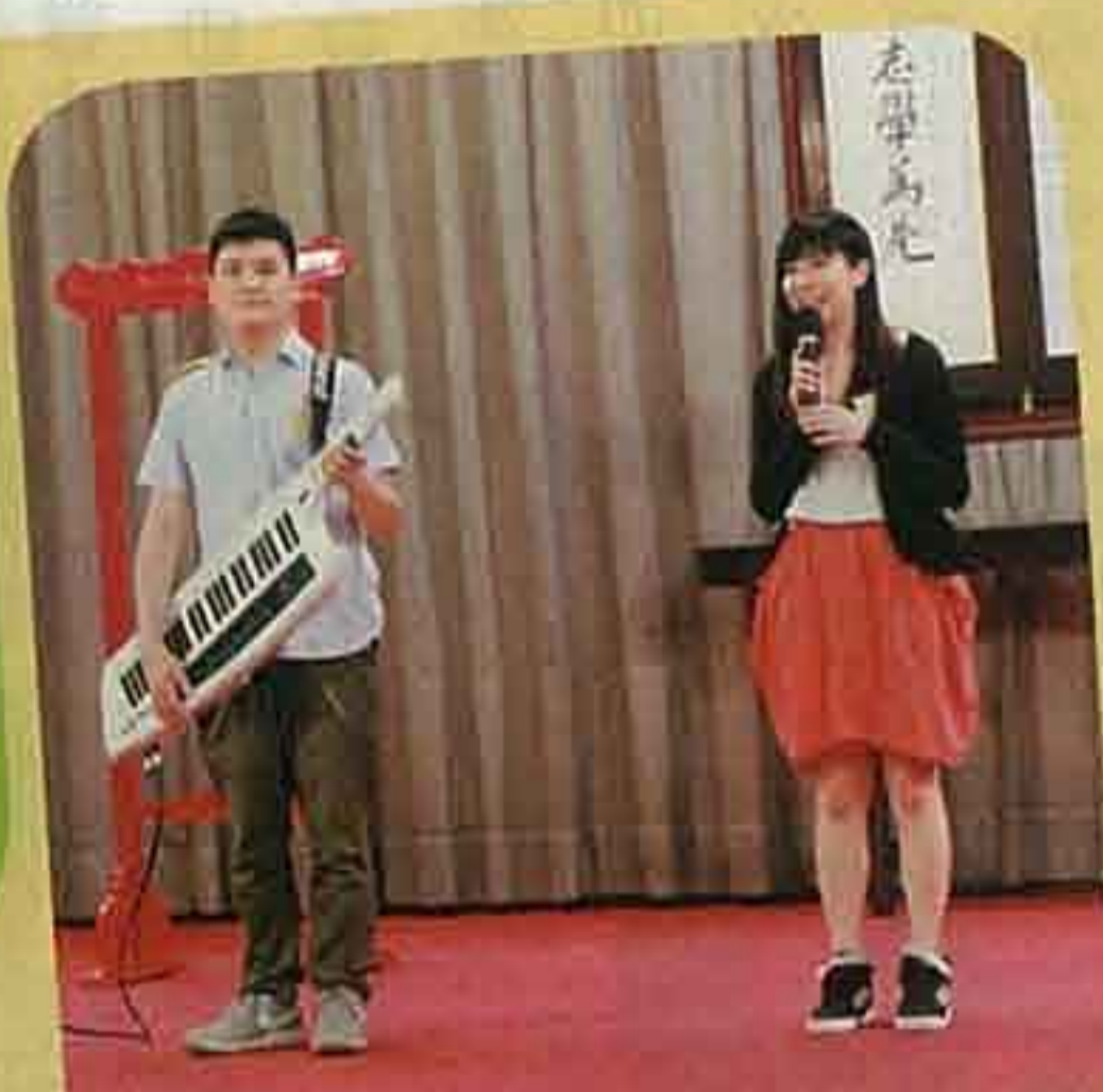
▲著名音樂人兼校友古馳（左），為該校六十年創作主題曲，並於校慶啟動禮當日回校高歌。