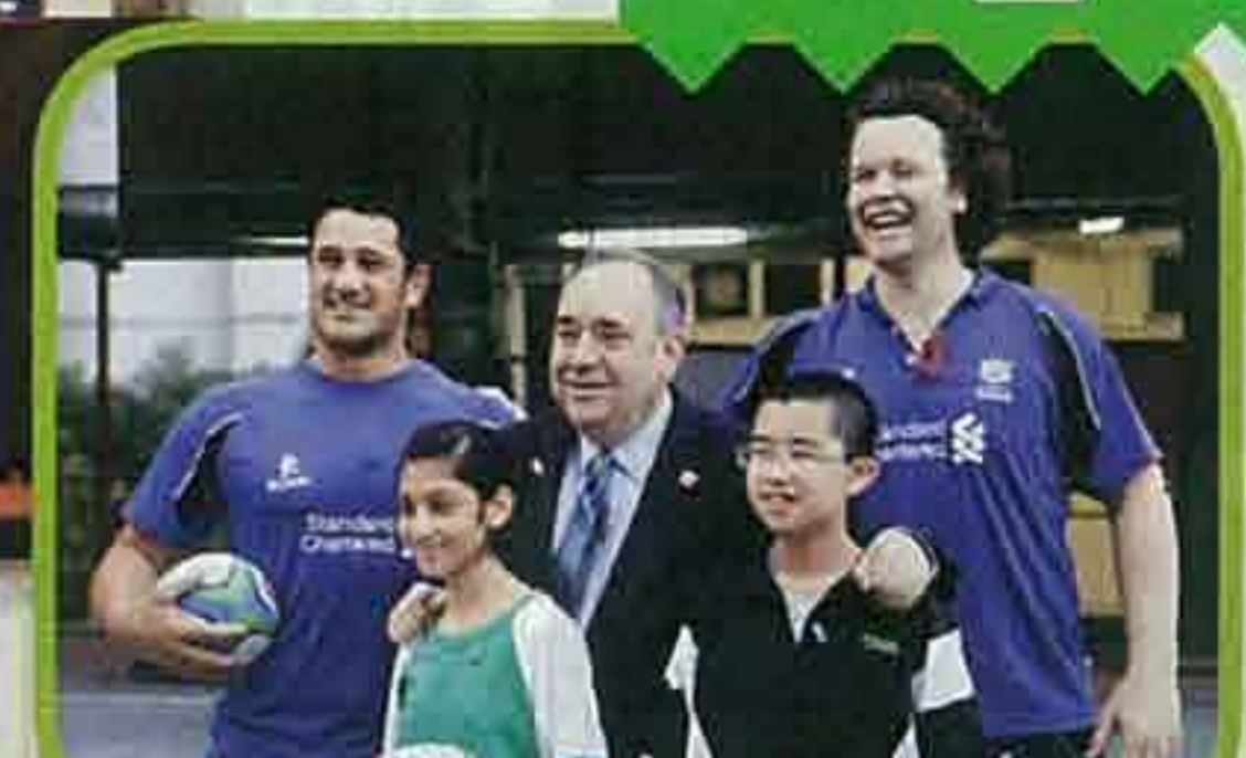
▲該校積極發展格鬥運動，蘇蒙球訓練，長蘇蒙球計劃的情況。