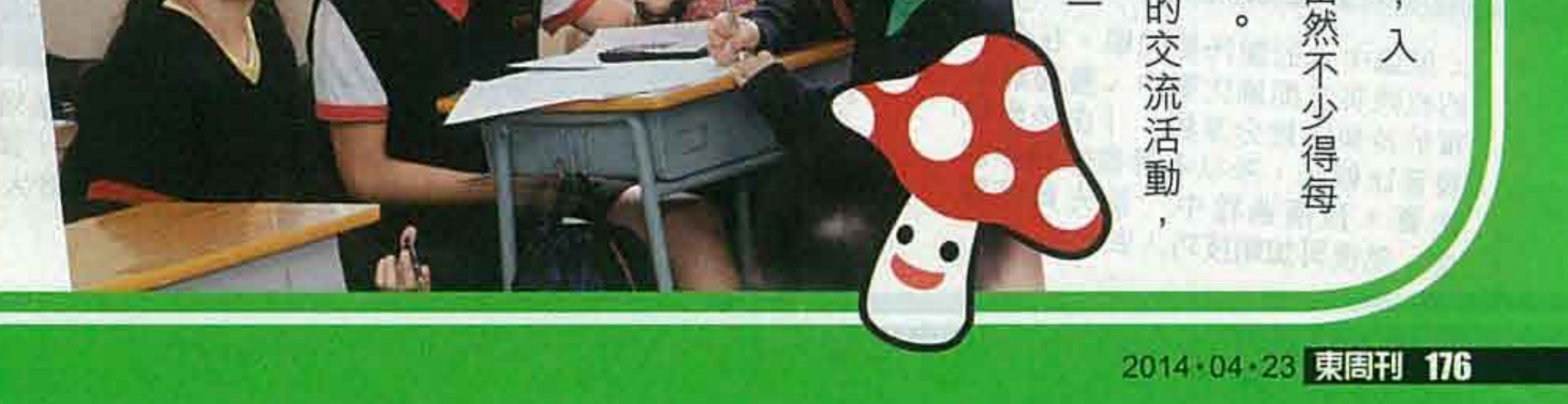
該校亦有取錄非本地學生，可以加強學生的共融和交流。

該校亦安排學生參加一些國際性的交流活動，好像有學生曾前往南京五日夜的第二屆世界中學生水資源保護研討會，當中有德國、印度和美國等學校的學生參加。該校學生還即場匯報對世界水資源缺乏的專題報告，除增加學生運用英語溝通的膽量之外，更幫助學生具備國際視野。因